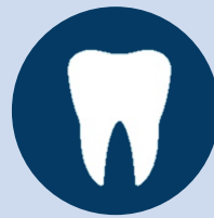
Asistencia dental o exámenes de la vista