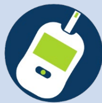
Suministros para análisis de glucosa en sangre